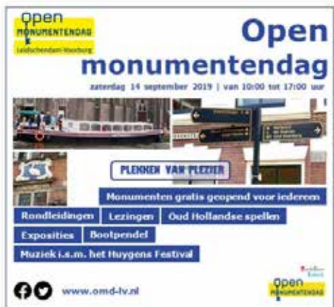
Advertentie Het Krantje